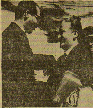
CITA LITERARIA.—José María Arguedas recibe el saludo del Inspector de Cultura y del Director de la Casa de la Cultura a su llegada a Arequipa para intervenir en el primer encuentro de narradores peruanos.

El campamento citado por ellos queda a 4 días de viaje a pie, saliendo desde Mazamari con dirección al río Pango. Mazamari está ubicado mucho más allá de la localidad de Vargas Llosa donde se sitúan los colonizadores.