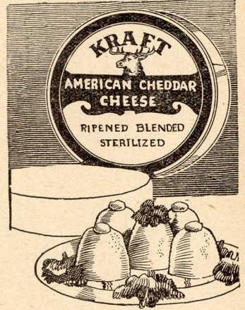
Si busca Ud. nuevo gusto a sus viandas, use Queso de KRAFT.