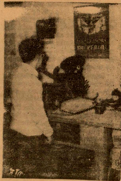
Imprimiendo en la Minerva

Las fotos dicen cómo el autor de "Determinamientos" y "Dédalo Dormido" —dos hermosas colecciones de versos— se entrega a su tarea de editar. Esfuerzo que se lleva a cabo por amor, sin interés lucrativo alguno, "La Rama Florida" (tal el nombre de la colección) es un hecho ejemplar, que manifiesta, sin duda, que aún quedan en el país gentes cuyo objetivo es dar y darse en una obra antes que nada espiritual.