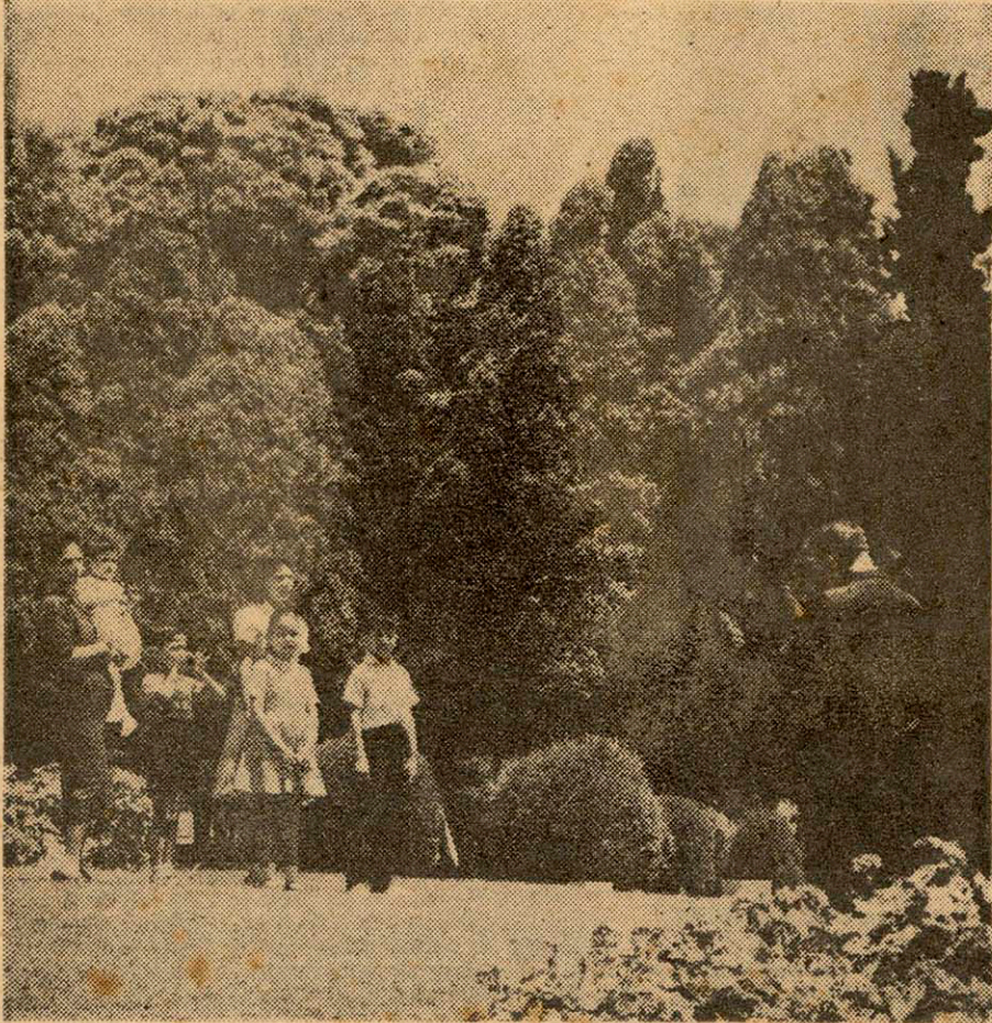
¿Dónde va el poblador citadino en sus días de descanso dominical? Al Parque.

Texto: Sebastián Salazar Bondy