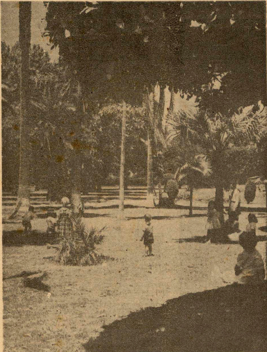
Algunas antiguas áreas verdes de Lima se han salvado de la urbanización. Hay que conservarlas.