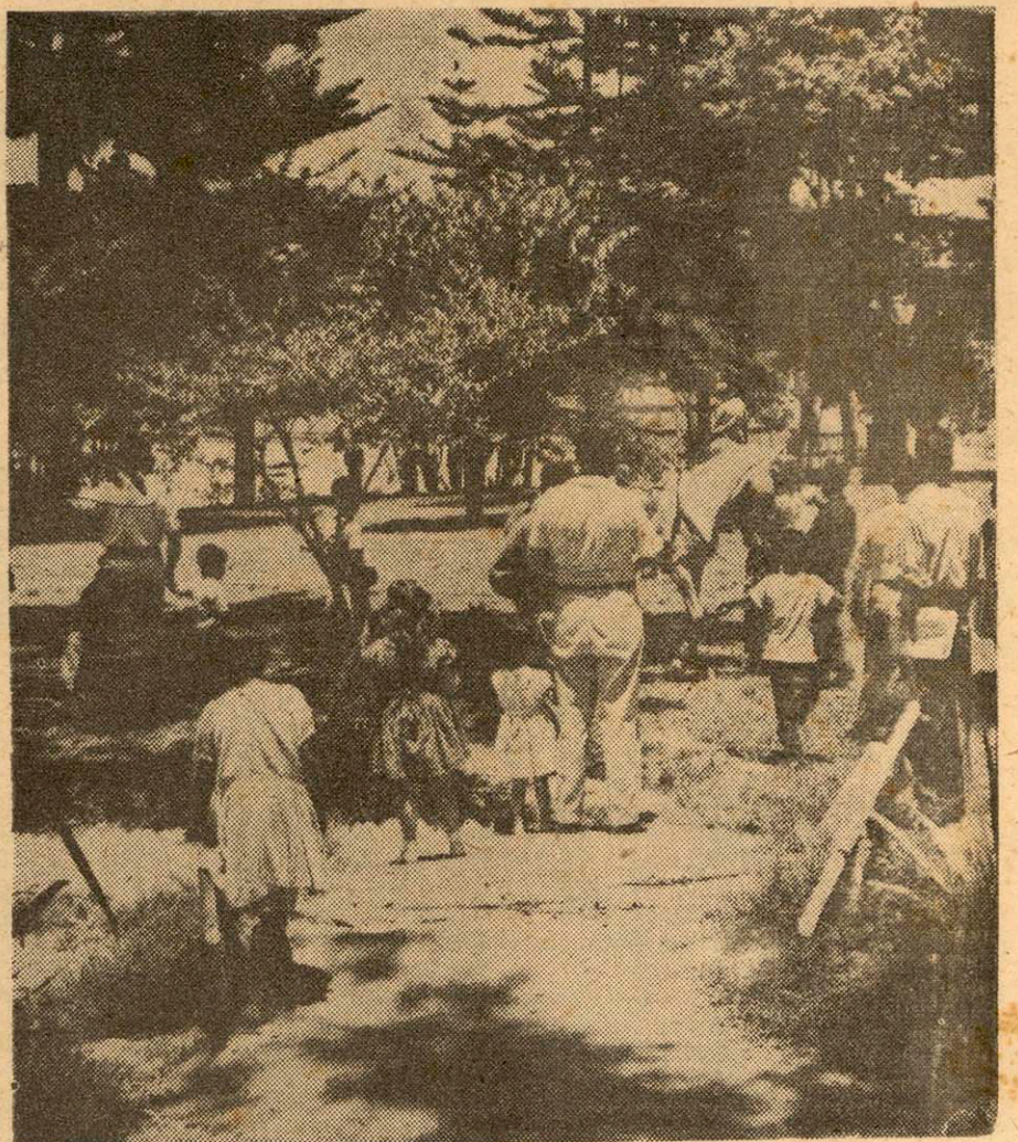
Pero son tan pocas que, a veces el abigarramiento es inevitable.