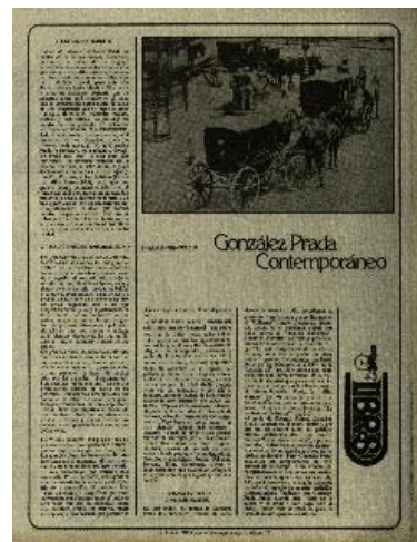
Artículo de Verástegui sobre MGP