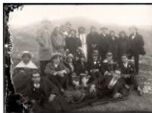
Foto. Obreros después de una fiesta.