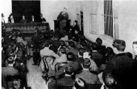
Foto: Manuel González Prada en San Marcos, fiesta universitaria. 1901