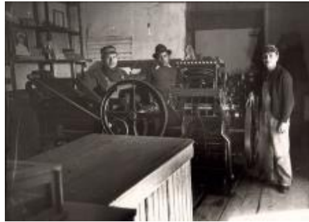
Foto. Imprenta en Morococha

c. El papel del periódico, la prensa en el movimiento anarquista: prensa para difundir sus ideas, medio que utilizan los anarquistas para publicar sus reclamos y leer.