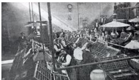
Imprenta del diario El Comercio

papel de los medios de prensa (periódicos y revistas) y espacios y eventos públicos donde difunde sus ideas. La mayoría de sus escritos aparecen primero en prensa.