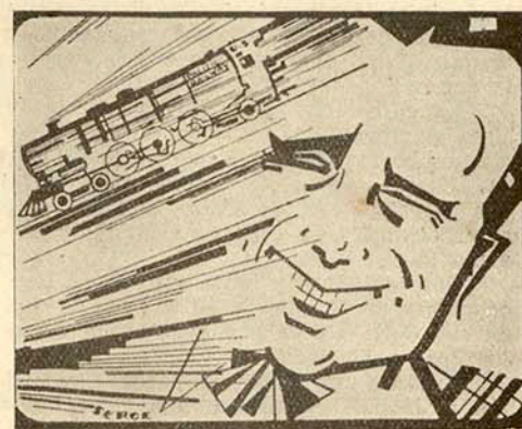
Douglas Fairbanks, por Serge