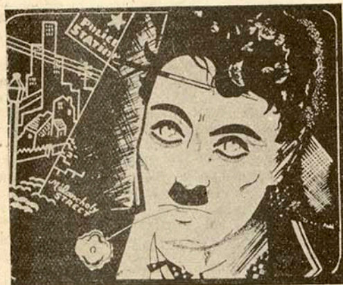
Un penetrante dibujo de Charlot, por el pintor ruso, Serge.

Existe el cinema? Fuego! Fuego! La pregunta, a estas horas, quema ya y pocos se atreven a responder negativamente. Un 90 por ciento, hemos dicho, están listos a votar por la existencia del cinema. El 8 por ciento votan, con todas sus manos, en contra. Ni uno ni otro bando, son pues, honestos, por que ambos están fanatizados. Sólo interesa la opinión libre y humanamente variable, según el múltiple proceso del espíritu del 2 por ciento