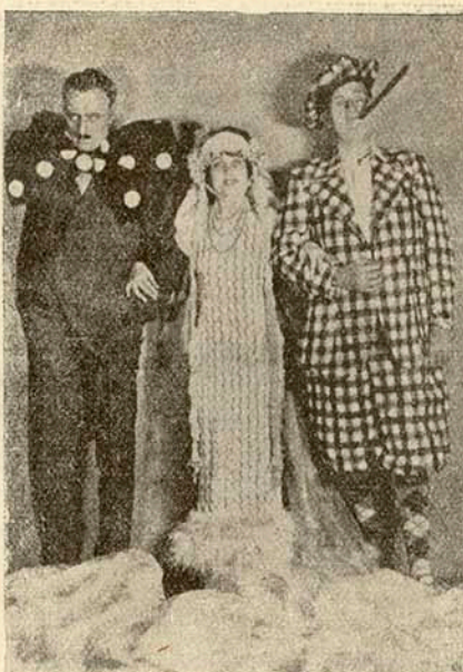
Dos picantes escenas de "Jazz", film norteamericana de vanguardia, en que los sueños se desmenuan según las ideas de Freud sobre los símbolos eróticos del reposo cerebral.