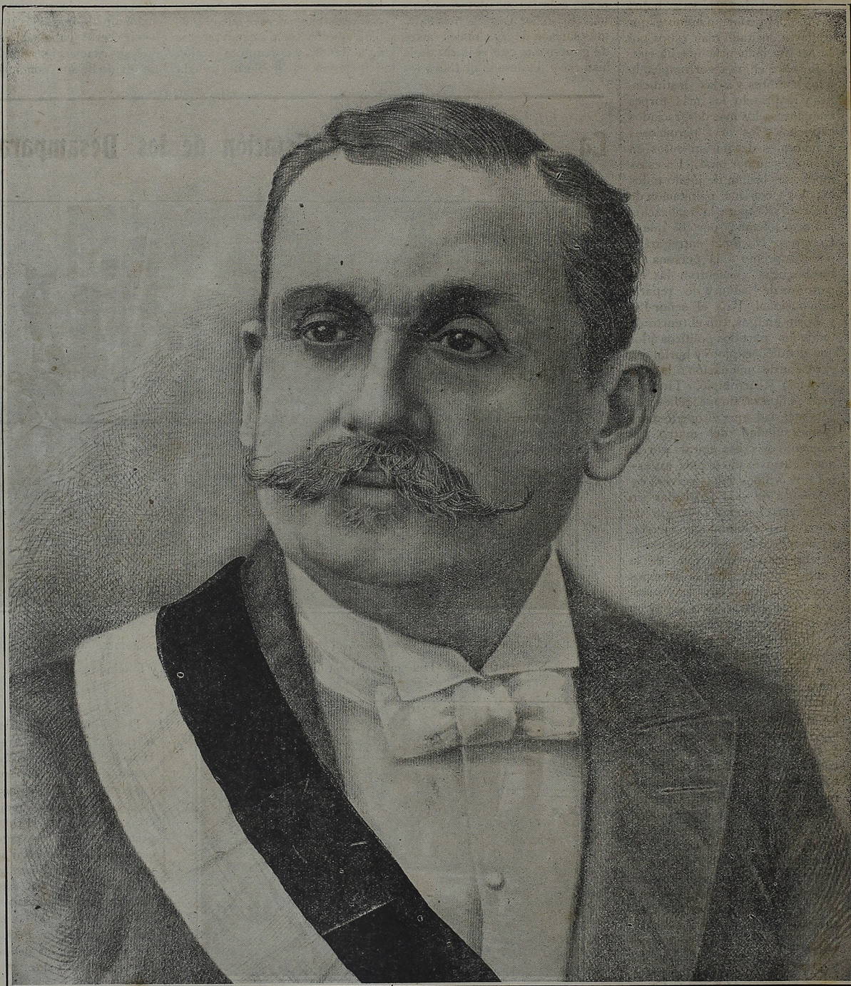
Excmo. Señor Guillermo E. Billinghurst, Presidente de la República—24 de Setiembre de 1912--24 de Setiembre de 1916