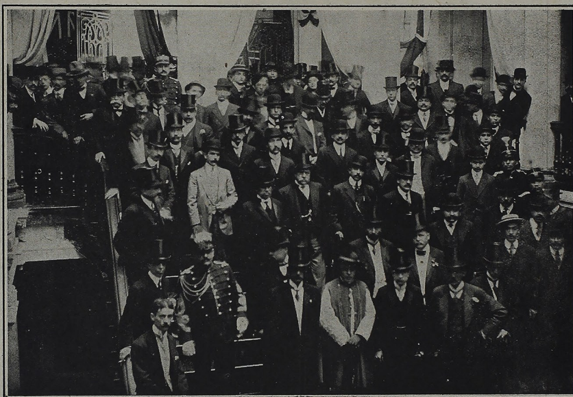
En el momento de la inauguración, el Presidente de la República, acompañado del Gerente, Superintendente, Delegado Apostólico, Ministros de Estado y funcionarios públicos