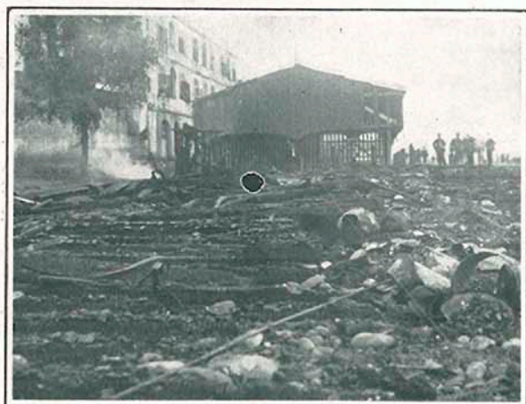
....."Campos de soledad, mustio collado

casas vecinas. A las cuatro y media de la mañana se había logrado dominar el incendio. Al principio se creyó que este había sido el resultado de una venganza de los empleados del Ferrocarril Central, que como se sabe están en huelga; también se ha juzgado que este incendio ha sido una transacción comercial, fundándose esta opinión en que el dueño del restaurant quemado tenía asegurado su establecimiento en dos compañías de seguros. Aun no se ha aclarado