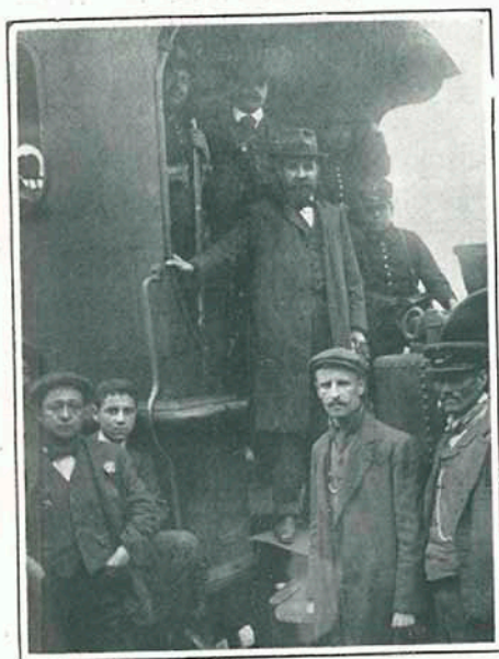
El Comisario del Central y los huelguistas