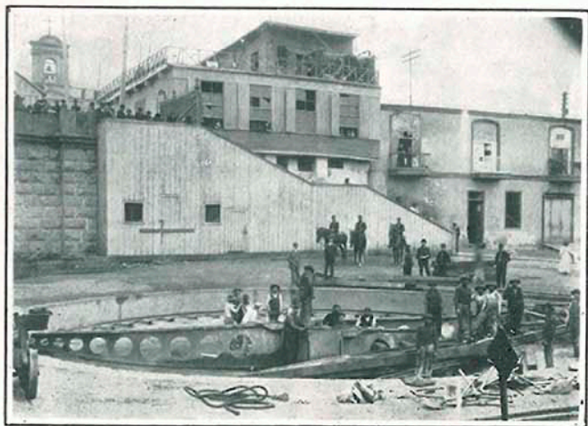
La bajada á la estación de Viterbo antes del siniestro