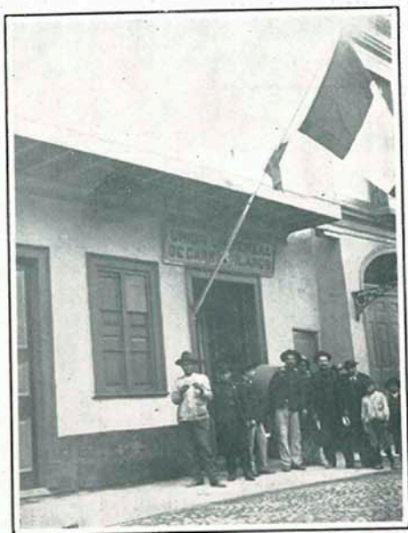
El local de los huelguistas en el Callao