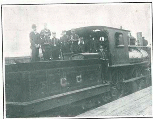
Una locomotora custodiada