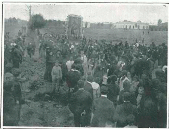
Procesión en la Victoria

El domingo en la tarde se verificó en los nuevos barrios de la Victoria una procesión religiosa que se vió muy concurrida por los devotos que habitan en esos progresistas barrios del ensanche de Lima. La fiesta fué consagrada á la virgen María y fué patrocinada por distinguidos miembros del cabildo metropolitano. Publicamos una vista de la religiosa ceremonia.