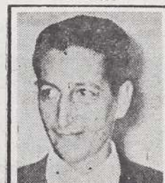
Sebastián Salazar Bondy: POBRES GENTES DE PARIS (Edic. Pop. 6 Tomos) S/. 20; Colección: