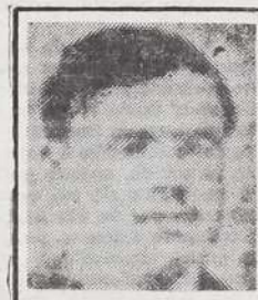
Fco. García Calderón: EN TORNO AL PERU Y AMERICA S/. 60.00