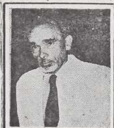
Alberto Hidalgo: BIOGRAFIA DE YO MISMO s/. S/. 40.00