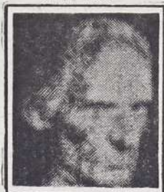
César Vallejo: TUNGSTENO. PACO YUNQUE S/. 28.00