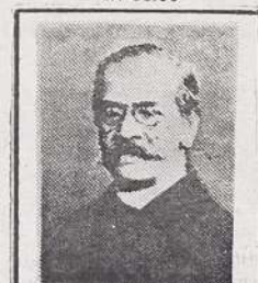
Ricardo Palma: TRADICIONES PERUANAS COMPLETAS 3a. Edic. S/. 125.00