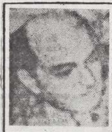
Jorge Basadre: LA PROMESA DE LA VIDA PERUANA (en Edic. Pop. 5 vols. S/. 20.00)