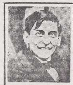
José Carlos Mariátegui: OBRAS COMPLETAS 10 vols. S/. 50.00