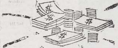
BOLSA DE VIAJE OBSEQUIO DE: "EL COMERCIO"