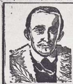
Inca Garcilaso de la Vega: COMENTARIOS REALES HISTORIA DEL PERU 3 vols. S/. 720.00