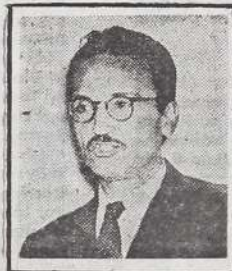
José María Arguedas: DIAMANTES Y PEDERNALES S/. 30.00

Librería "STUDIUM" Jr. Camaná (Amargura) 954 - Lima Librería "MEJIA BACA" Jr. Azángaro 722 - Lima Librería "LA UNIVERSIDAD" Av. Nicolás de Piérola 639 - Lima Librerías "LA FAMILIA" Bejarano 264 - Galerías Boza y Av. Larco 580 - Miraflores