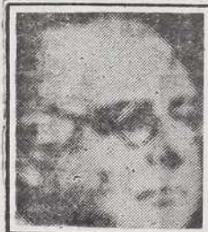
José de la Riva Agüero: PAISAJES PERUANOS S/. 60.00