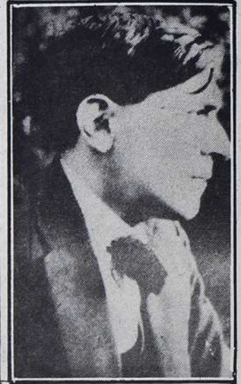
Victor Andrés Belaúnde, Luis E. Valcárcel y José Carlos Mariátegui representaron tres posiciones diversas frente al problema indígena.