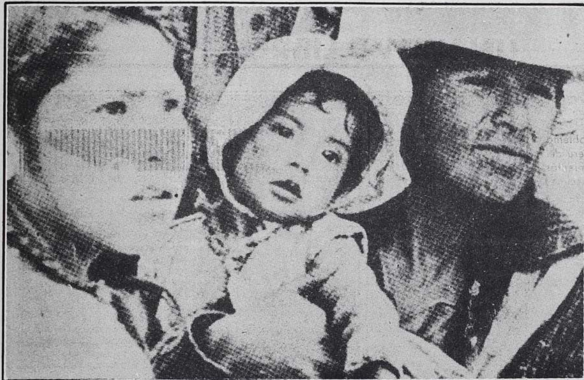
Los principales problemas planteados por el debate sobre el indigenismo sirven aún para diferenciar divergentes posiciones.